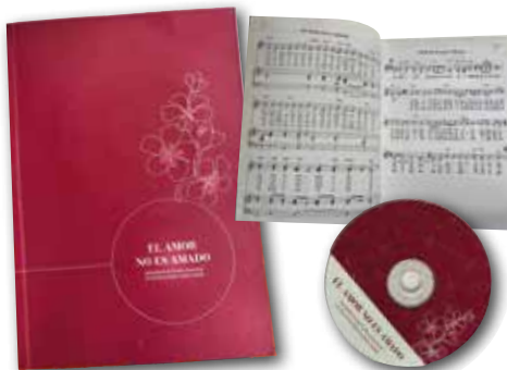
Sor Purezak idatzitako partitura liburua eta CDa.

Beloradoko mojen auzian Burgosko Artzapezpikutzak eskumikatu ez zituen bost ahizpetako bat da. Urduñako komentutik erreskatatu zuten, mojek hara eraman baitzuten bere gogoaren kontra.