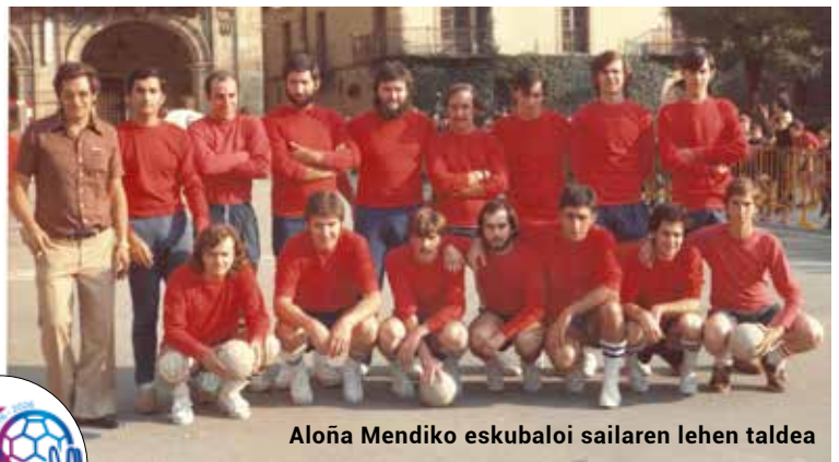
Aloña Mendiko eskubaloi sailaren lehen taldea