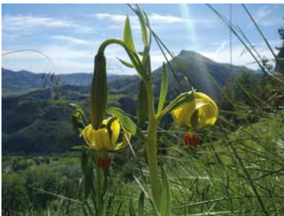
Goian, sugedorri kantauriarra; ezkerrean, zitori horia.

Geure inguruan ere baditugu endemismoak (animaliak, onddoak eta landareak), zaindu eta kontserbatu beharrekoak, denak. Izan ere, leku zehatz batean ugariak izan arren, hedadura txikia okupatzen dute, eta populazioa, are espeziea, arriskuan egon daiteke, ekosistemaren aldaketen aurrean. Horregatik, babes izaera ofiziala izaten dute espezie endemiko guztiek eta bizi direneko habitatek, eta geuk ere balioan jarri eta zaindu egin behar ditugu!