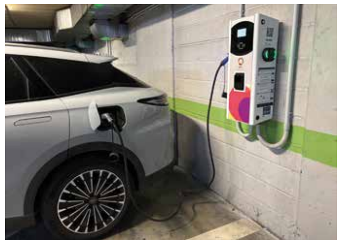
Gogoratu, lehen hiru orduak dohainik direla eta denbora hori nahikoa dela karga osoa egiteko.