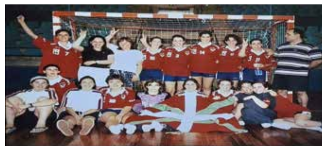
1998an Espainiako txapelketan 3. sailkatu zen taldea

Jubenil eta Kadeteak Euskal Ligan, beste kadete bat lurralde mailan, infantilen lau talde...".