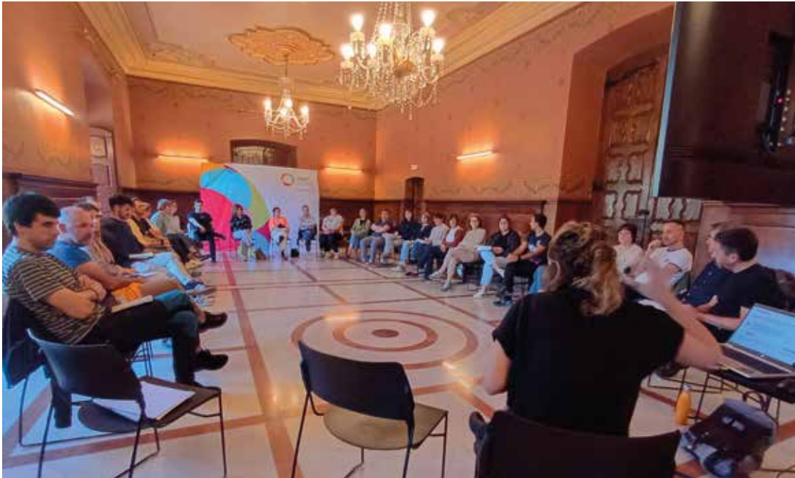
◀ Emaizten irakurketa eta komunikazio saioa. 2026ko apirilaren 16. Oñatiko Udala.